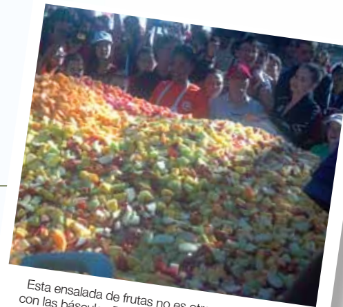
Esta ensalada de frutas no es otra cosa que light; con las básculas Rice Lake indicando precisamente 11,197 libras.

Ahora la gente de Mazatlan tiene que legitimar el título para anexarlo a es orgullo: el record mundial Guinness para el coctel de camarones que jamás se haya preparado. Una vez agregados a la copa del coctel todos los camarones, agregada la salsa, y la copa se adornó meticulosamente con más camarones, cada uno del tamaño de un hotdog , la báscula de piso RoughDeck® de Rice Lake indicó el increíble peso de 1,187-libras y 3 onzas. Victor Santana, Solo Peso, suministró el equipo de pesaje. ■