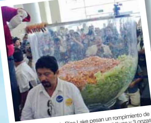
Básculas de piso de Rice Lake pesan un rompimiento de peso de un coctel de camarones de 1,187 libras y 3 onzas.